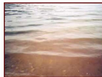
Fleur d'eau d'une espèce de cyanobactéries à pigments rouges. Lac Bourget, France

industrielles non ou peu traitées, fumier ou engrais épanché sur les sols et les pelouses, excréments d'animaux, etc. Ces sources sont directement reliées à l'action de l'homme sur son milieu. Nous avons donc le pouvoir d'y remédier.