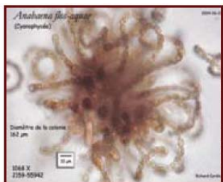
Cyanobactéries au microscope. Avec une échelle de 10 micromètres = 1/100 millimètre

Ces sources de phosphore sont directement reliées à l'action de l'homme sur son milieu. Nous avons donc le pouvoir d'y remédier.