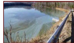
Fleur d'eau de cyanobactéries sous forme d'écume turquoise en surface. Lac Victoria, Northfield, novembre 2004

verticalement dans la colonne d'eau afin de se positionner à l'emplacement où les conditions leur sont optimales. Cette capacité se nomme la « flottabilité ». La distribution des fleur d'eau de cyanobactéries peut donc varier selon les endroits et, dans le même plan d'eau affecté, selon la