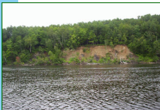
Érosion des berges par glissement sur la rivière Saint-Maurice

EN EFFET, IL EST PRIMORDIAL DE COMPRENDRE QUE L'ÉVÉNEMENT D'ÉROSION QUE SUBIT ACTUELLEMENT LA RIVIÈRE PEUT ÊTRE DÛ AUTANT À DES FACTEURS HUMAINS QU'À DES FACTEURS NATURELS.