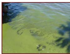
Fleur d'eau de cyanobactéries notamment sous forme d'écume. Lac Nathe, Saint-Aimé-des-Lacs, septembre 2004

L'apparition des cyanobactéries dépend de plusieurs facteurs et leur présence comporte des conséquences pour le milieu et son utilisation par l'homme. Ces points sont élaborés plus bas.