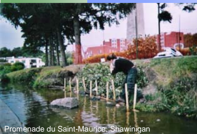
Promenade du Saint-Maurice, Shawinigan